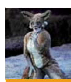
Isabel Bayrakdarian Bystrouška, la volpe

La piccola volpe astuta ha inaugurato la stagione 2009-10 del Maggio Musicale Fiorentino. Bella cosa, perché questo titolo non è pratica che si sbrighi tutti i giorni. Ma il colpo di genio dei