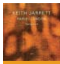
Keith Jarrett Testament (Ecm)

Quando parla di Keith Jarrett la critica mette spesso in relazione uomo e musicista, tentando di spiegare il secondo per mezzo del primo. È curioso però che lo faccia Jarrett stesso. Testament è esplicito fin dal titolo. L'album triplo racchiude due concerti di fine 2008, tenuti a Parigi e a Londra in un momento particolarmente doloroso per il pianista americano, appena abbandonato dalla moglie. Sarebbe stato ancora capace di inventare quegli universi