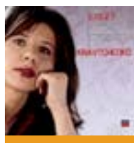
Franz Liszt Sonata in si minore per pianoforte (Decca)