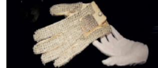
Il guanto «Moonwalk» di Michael Jackson

L'ABITO indossato dal Re del Pop nel corso della sua ultima performance all'Apollo Theatre di New York è stato venduto a 170.000 dollari; la battaglia più accesa si è però registrata per la giacca indossata da Jackson durante il «Bad Tour»: l'ha avuta vinta un americano per 225.000 dollari.